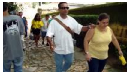
Figura 3. “Percurso comentado” com uma pessoa com deficiência visual ao Museu Casa da Hera, em Vassouras.