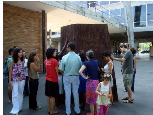
Figura 15. MAM-RJ – pessoas cegas tocando em esculturas na área externa do museu.