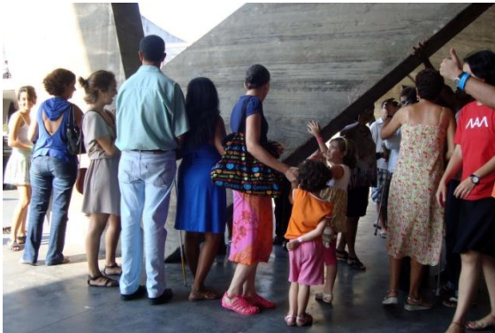
Figura 14. MAM-RJ – deficientes visuais tocando na arquitetura do museu.

Outro exemplo é a experiência dos “Encontros multissensoriais”, organizada pelo Núcleo Experimental de Educação e Arte do Museu de Arte Moderna do Rio de Janeiro (MAM-RJ) em parceria com o NUCC, da UFRJ, coordenado por Virgínia Kastrup. Vivências de pessoas videntes e pessoas cegas são compartilhadas na apreciação do entorno, da arquitetura e de algumas obras do museu, quando são exploradas “diferentes formas de ver e não ver, envolvendo não apenas a visão, mas também o tato, a audição, o olfato etc.” (Núcleo Experimental de Educação e Arte, MAM-RJ, 2011).