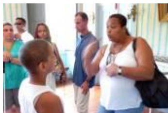
Figura 2. Comunicação na Língua Brasileira de Sinais (Libras) no “percurso comentado”.