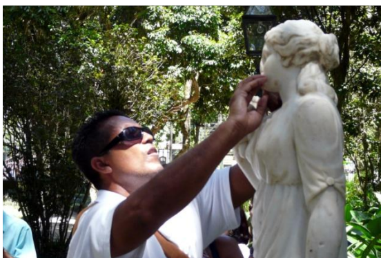
Figura 10. Museu Imperial de Petrópolis – práticas sensoriais para pessoas cegas.

Utilizo o toque todos os dias. É uma coisa funcional para mim. Às vezes, é uma coisa amável tocar coisas que parecem agradáveis, mas frequentemente é como eu navego no mundo. O cheiro é a mesma coisa e absoluto, áudio também é fundamental. Nós devemos possuir algum sentido humano inato de desejar conhecer o máximo que podemos acerca do mundo ao nosso redor, tanto quanto se faltar uma de suas maneiras de fazer isto, você utiliza tudo o que você pode. (Catherine Mahony. Tocando em coisas que parecem agradáveis , 2008)