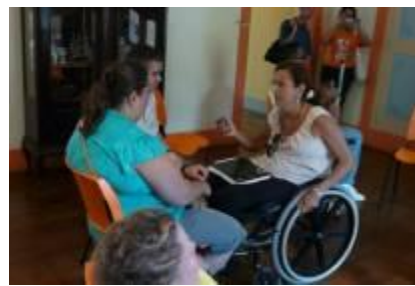
Figura 6. Entrevista com uma pessoa com deficiência visual no Museu Casa da Hera de Vassouras.