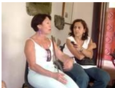
Figura 5. Entrevista com uma pessoa com deficiência visual no Museu de Arte de Cabo Frio.