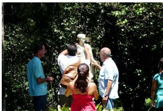
Figura 11. Museu Imperial de Petrópolis – práticas sensoriais para pessoas cegas.

Já se pode perceber, no Brasil, a existência de ambiências que também buscam seguir essas perspectivas de uma acessibilidade cultural, sensorial e emocional.