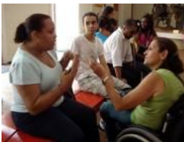
Figura 4. Entrevista com a mãe de uma menina com deficiência auditiva no Museu Nacional.