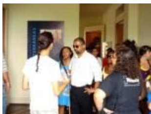
Figura 1. Percurso comentado e orientado.

Acompanhávamos essas trajetórias com o auxílio de funcionários conhecedores do local. Íamos também orientando em certos passos a serem dados para guiar o grupo e poder passar o maior número possível de informações. Encerrado o percurso comentado, procurávamos um lugar bem tranquilo, onde podíamos colher e gravar os depoimentos das experiências vividas e da percepção que tiveram daquela ambiência que percorreram.