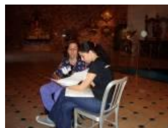
Figura 9. Entrevista com a arte-educadora do Instituto Brennand, em Recife.

O que eu tenho a dizer é que é uma relação de fato muito delicada, porque determinadas intervenções nas edificações acabam descaracterizando de uma maneira ou de outra o monumento. É obvio que existem soluções, as mais diversas possíveis, mas o que acontece é que há uma legislação que é conflituosa que é a relação de uma lei que obriga a ter cuidados especiais com o prédio por conta do tombamento. (M. V. G. J., arquiteto de Cabo Frio)