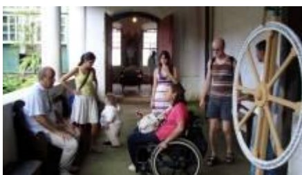
Figura 7. Entrevista e depoimento do diretor dos museus de Paraty.